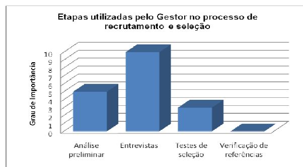
Figura 1 – Etapas utilizadas pelo Gestor no processo de recrutamento e seleção

Em poucos casos se utilizam de testes práticos. Se a vaga for para a área rural o principal requisito exigido é a experiência com o trabalho rural, devido ao serviço ser muito árduo. De acordo com o gestor, nos dois setores observa-se que a etapa do processo de seleção mais utilizada é da entrevista, conforme a Figura 1, tanto para área rural quanto para o setor administrativo.