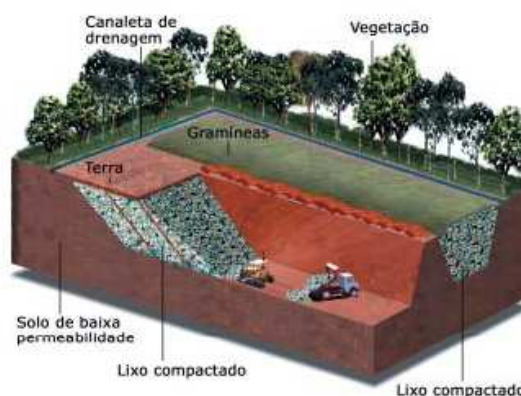
Figura 1– Aterro controlado de Macarani/BA – Método Trincheira.

Após a revisão bibliográfica realizada foi possível identificar o aterro controlado uma forma de disposição final de RSU nos solos, na qual as precauções tecnológicas executivas adotadas durante o desenvolvimento do aterro, como o recobrimento dos resíduos com argila (na maioria das vezes sem compactação), minimizando os riscos de impactos ao meio ambiente e à saúde pública é realizado. O aterro controlado era adotado, no Brasil, como uma solução para aproximadamente 13% dos municípios (BIDONE e POVINELLI, 1999). Entretanto em 2009 passou a ser utilizado por 31,2% (ANDRADE e FERREIRA, 2011)