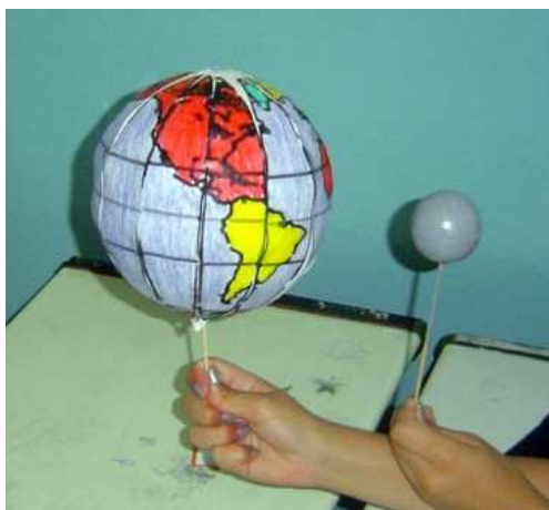
Figura 2 – Exemplo de um dos globos terrestres confeccionados, juntamente com a Lua.

do ano nos hemisférios terrestres, conforme ilustrado nas imagens da Figura 3.