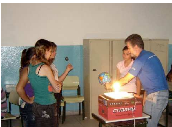
Figura 3 – Reprodução de fenômenos astronômicos por meio da manipulação do globo terrestre junto com a luminária.

Depois de manipular a “maquete” e reproduzir os fenômenos, foi aplicado um pequeno questionário contendo 5 questões, visando avaliar