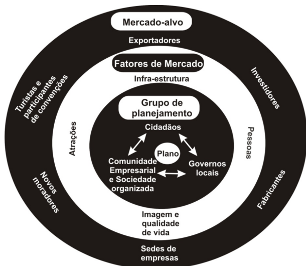
Figura 2 - Níveis do planejamento de localidade Fonte - adaptado de Kotler (1994).

Kotler (1994), elabora um síntese gráfica de como pode ser construída a participação dos envolvidos como também resume os fatores que devem ser mensurados no planejamento (figura 02).