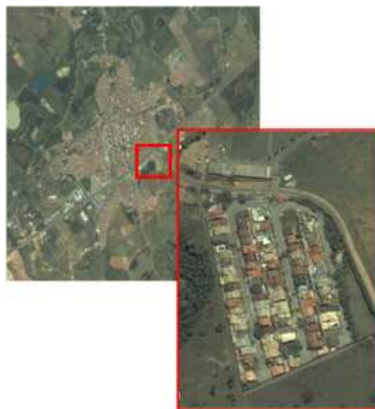
Figura 2 – Imagem de satélite de um loteamento fechado no município de Caçapava.

Atualmente, o município se encontra em grande processo de urbanização. Desta forma, a área urbana se expandiu, expansão esta caracterizada também pela ocupação de áreas rurais e de áreas próximas a reservas ecológicas. A expansão ocorre em todas as regiões da cidade, com o surgimento de novas formas de urbanização. Essas novas formas são os condomínios horizontais fechados e os loteamentos fechados (figura 2 e 3).