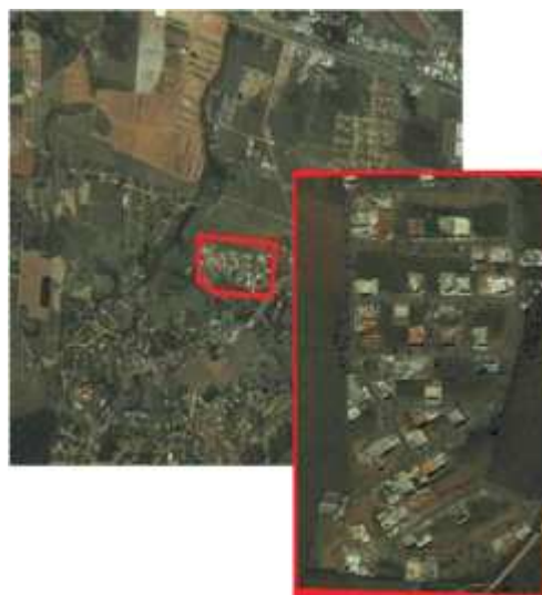
Figura 3 – Imagem de satélite de um Condomínio fechado no município de Caçapava.

Estas figuras demonstram as características espaciais e extensão de loteamentos ao longo do município. Recentemente, tem havido uma procura maior da população de alto e médio poder aquisitivo por condomínios e loteamentos de alto padrão, cuja localização é, preferencialmente, áreas rurais distantes do centro. Entende-se que as áreas mencionadas, enquanto não ocupadas, funcionam como uma reserva de valor, ficando a espera do mercado imobiliário para atender às novas demandas da sociedade. Isso faz surgir uma nova estrutura e uma nova segregação-espacial no