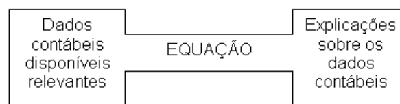
Figura 2 – Formalização da Equação

Segundo MARION e SILVA (1986): Capacidade Explicativa : "Uma equação é tanto melhor quanto maior o aspecto explicado por ela. A equação deve abarcar um maior número de dados contábeis possíveis e disponíveis e relevantes."